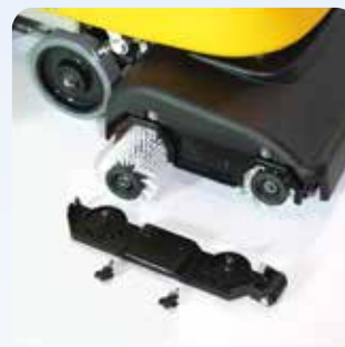
Stroj z valjčnimi ščetkami, ki jih namestimo iz strani

Jade 55c/ct je naš najmanjši stroj z valjčnimi ščetkami, s teoretično zmogljivostjo do 2475m 2 /h. Z dvema hitro-vrtečimima valjčnima ščetkama z 900 obrati na minuto odlično očisti strukturirane površine, površine z večjimi fugami, razmaki in površine s protizdrsnimi utori. Obe ščetki z vrtenjem poganjata stroj naprej, dodatno pa lahko stroj poganja pogonski motor. Stroj je tudi zelo enostaven za vzdrževanje in je optimalno razmerje med ceno in zmogljivostjo.