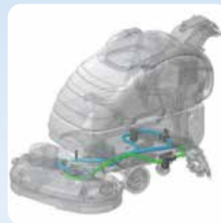
Sistem enakomernega doziranja čistilne raztopine 3S (Solution Saving System)

Jade 66 je stroj iz serije z najširšo delovno širino, kapacitete 3000m 2 /h in s kar do 50 kilogramskim pritiskom ščetk na podlago, s čemer stroj izjemno dobro čisti in je primeren za velike površine. Primeren je za industrijsko uporabo, saj je opremljen z aluminijasto glavo ščetke, ki je elastično vpeta na karoserijo stroja s čemer se vibracije ščetke ne prenašajo na stroj.